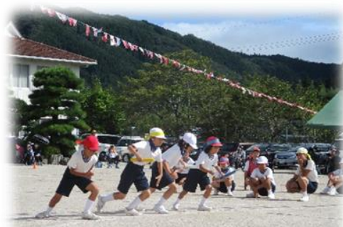
（昨年の運動会より）

5月に予定していましたが、緊急事態宣言の影響で延期していました。当初は、保護者の方・地域の皆様方と賑やかに楽しく行いたいと思っていました。しかし、延期したにもかかわらず、残念ながら以下のように市内統一して、規模を縮小して行うことになりました。