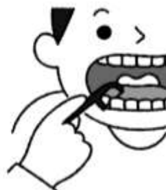
歯間ブラシやフロスも使って 歯と歯の間もきれいに