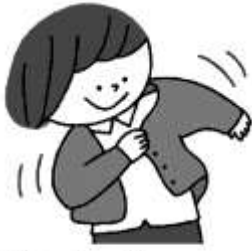
冷暖の差が激しいので、 衣服で気温の調節を