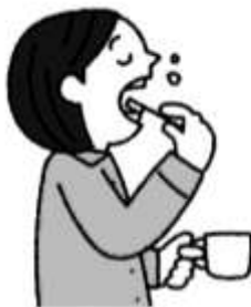
寝ている間に増える歯垢 寝る前の歯みがきが大事