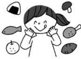
食欲の秋だけど、食べすぎに 注意して栄養バランスよく