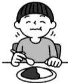
よく噛んで食べる 唾液は歯のガードマン