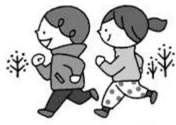
かぜの流行りやすい冬に 備えて体力をつけておこう