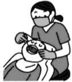
定期的に歯科医院で 歯の健康チェック!