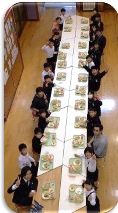
全校なかよし給食