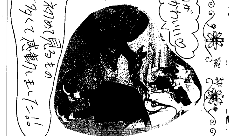
初めて見るもの が初めて感動しました!!