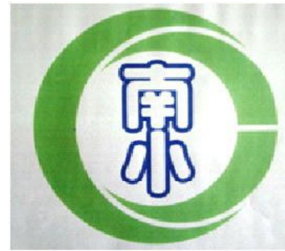
新見南小学校校章

去る、1月11日、新見南小学校の校章が決定しました。新見南小学校の「に」をモチーフに、中に「南小」の文字。統合する小学校の貴重な歴史や伝統、勉学・スポーツ・芸術・文化の