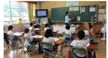
(道徳の授業での話し合い)