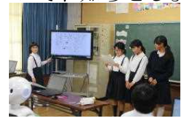
(プログラミング学習の発表)