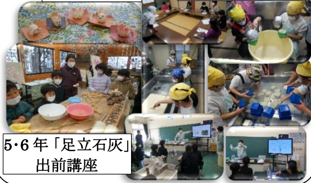
5・6年「足立石灰」出前講座