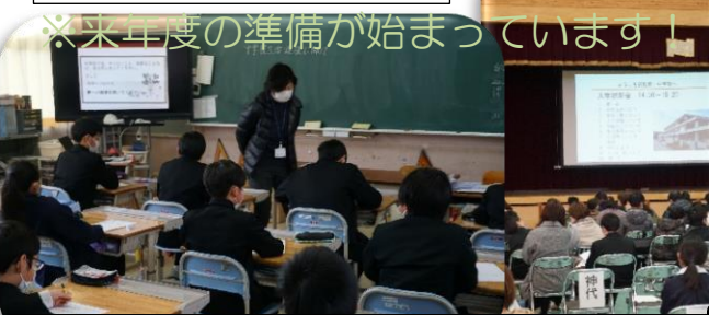
新入生5名体験入学 1・2年がおもてなし